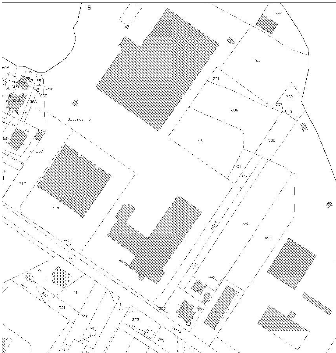
Estratto di mappa scala 1:2000